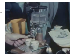
Salon des arts ménagers à Paris 1969

Formule : Prix de la chaîne Hifi / Salaire Net x 100