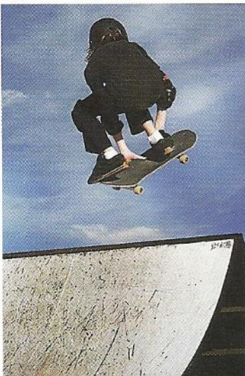
e Les loisirs