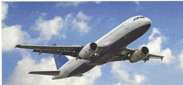
c Les transports